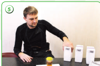
5 Выбор комплекта для хранения пробы