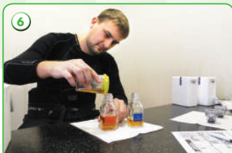
6 Разделение пробы по флаконам «А» и «В»